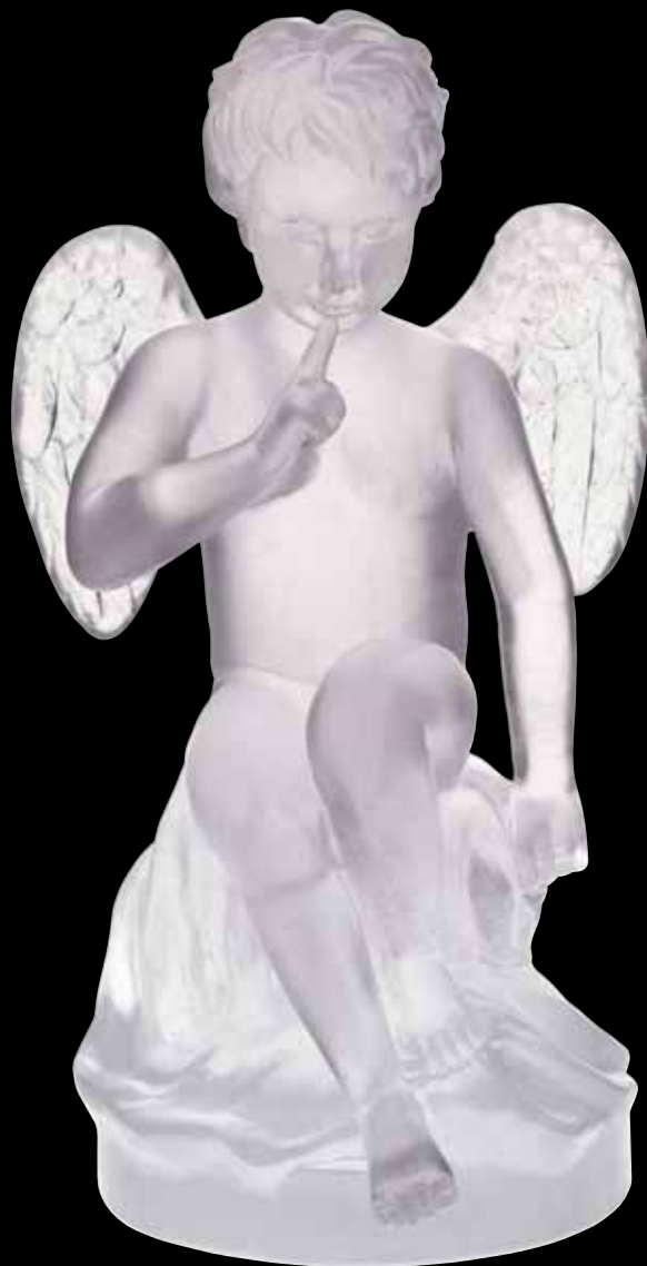
Cupidon Édition limitée à 375 ex H: 34 cm - 13 1/4" 03491