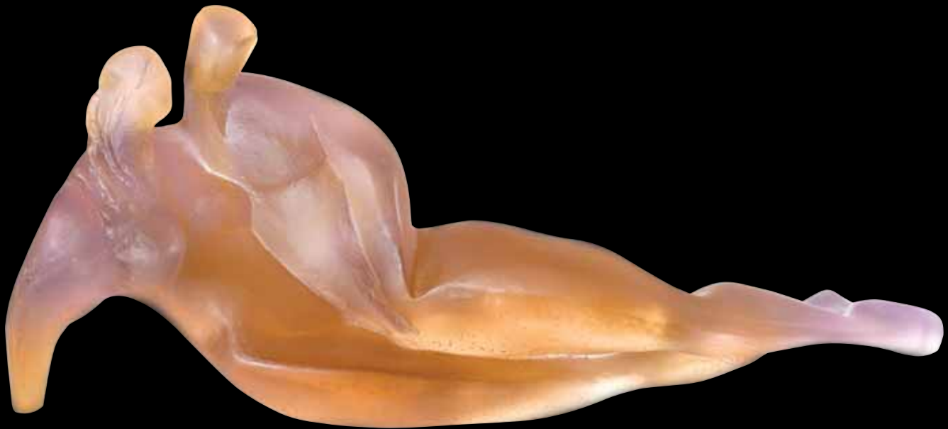
Intimité Édition limitée à 500 ex L: 29 cm - 11 1/3" 03509