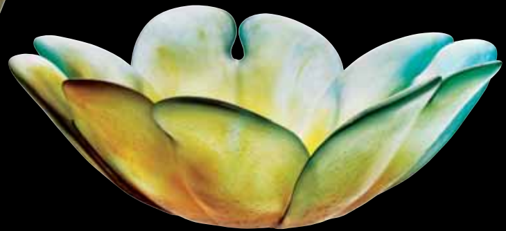
Coupe / Bowl Pièce numérotée / Numbered piece Ø: 40 cm - 15 3/5" 03486