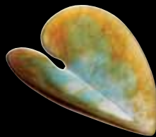
Coupelle / Small bowl L: 10 cm - 3 9/10" 03487