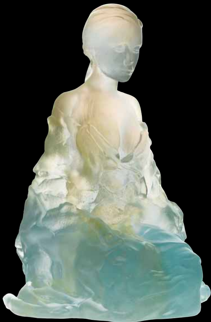
Athéna Édition limitée à 375 ex H: 46 cm - 17 3/4" 03011