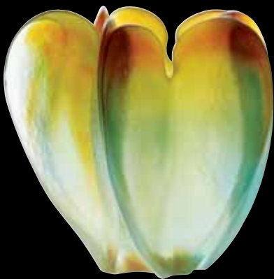
Vase H: 17 cm / Vase H: 17 cm Pièce numérotée / Numbered piece H: 17 cm - 6 7/10" 03485