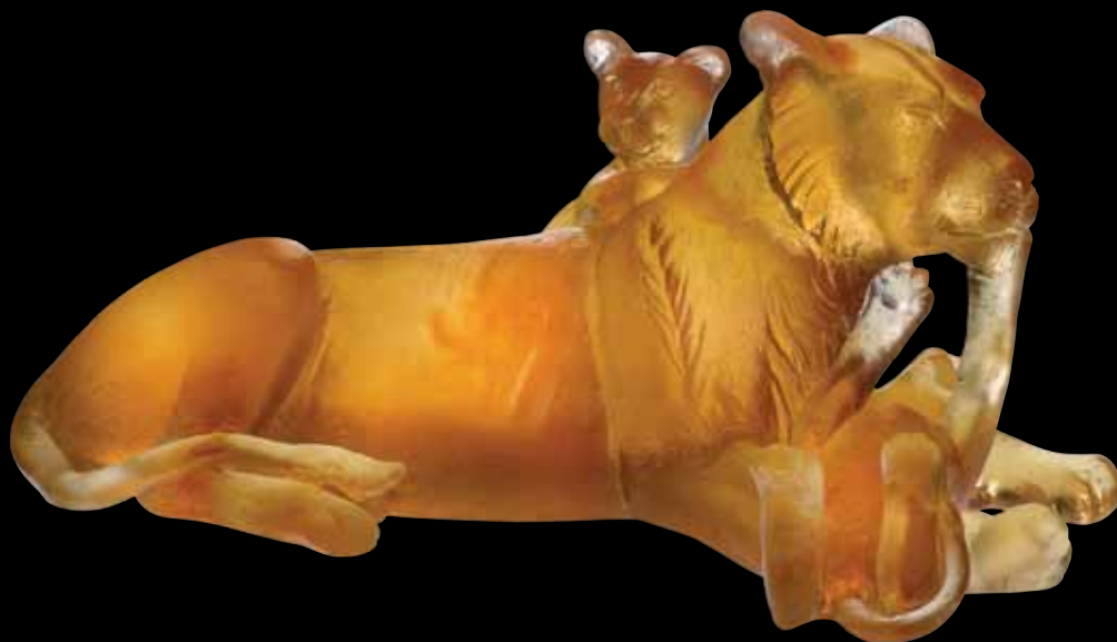
Maternity Lion Pièce numérotée / Numbered piece L: 28 cm - 11" 03496