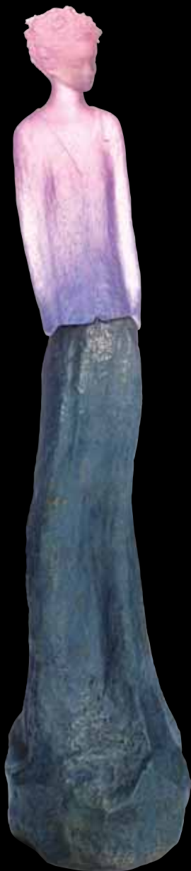
Charlotte Édition limitée à 175 ex H: 138 cm - 53 8/9" 03171