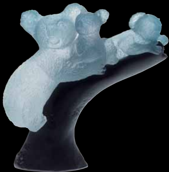
Maternity Koala H: 12 cm - 4 5/7" 03489