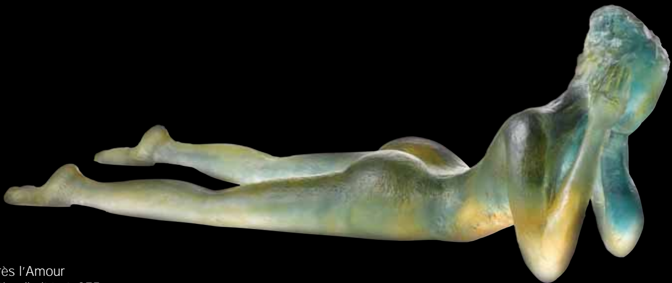
Après l'Amour Édition limitée à 375 ex L: 66 cm - 26" 03497