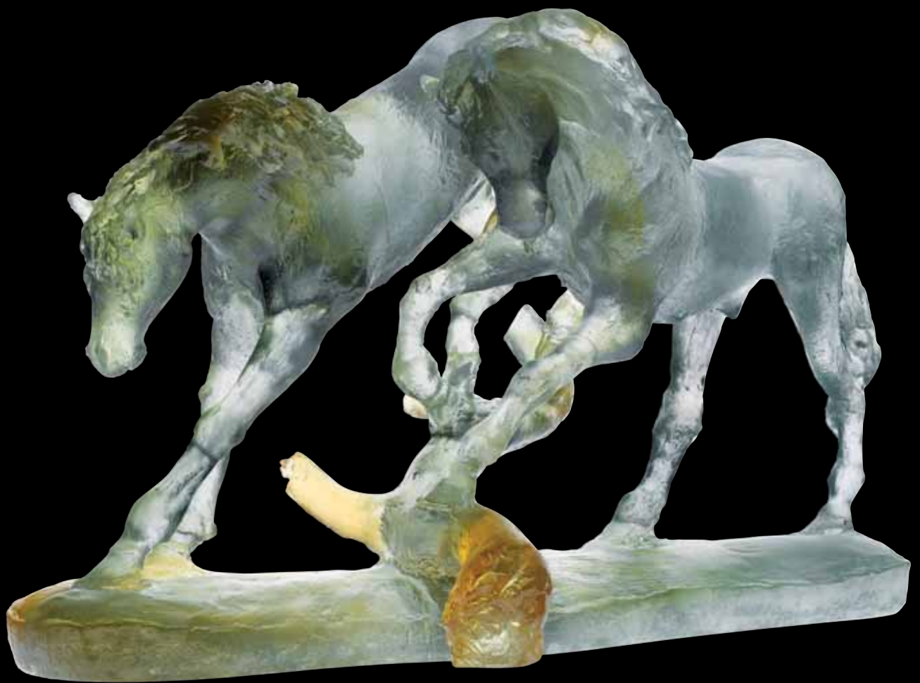
Love Horses Édition limitée à 1000 ex L: 44 cm - 17 1/3" 03197