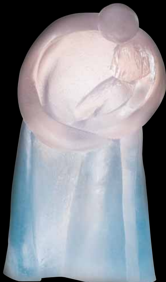
Le deuxième Baiser Édition limitée à 375 ex H: 33 cm - 13" 03138