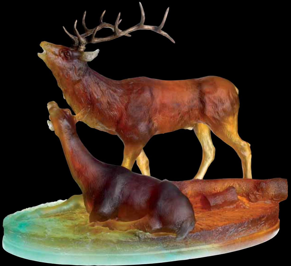
Love Deers Édition limitée à 1000 ex L: 48 cm - 18 3/4" 03498