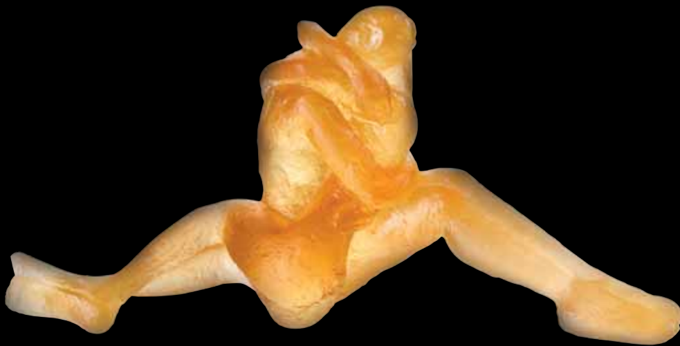
Passion Édition limitée à 500 ex L: 31 cm - 11 1/3" 03508