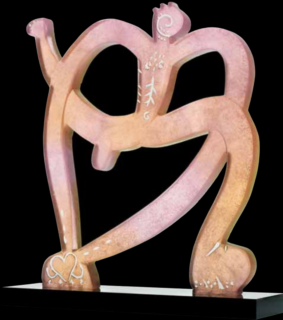
L'Amoureux Édition limitée à 500 ex H: 31 cm - 11 1/3" 03085