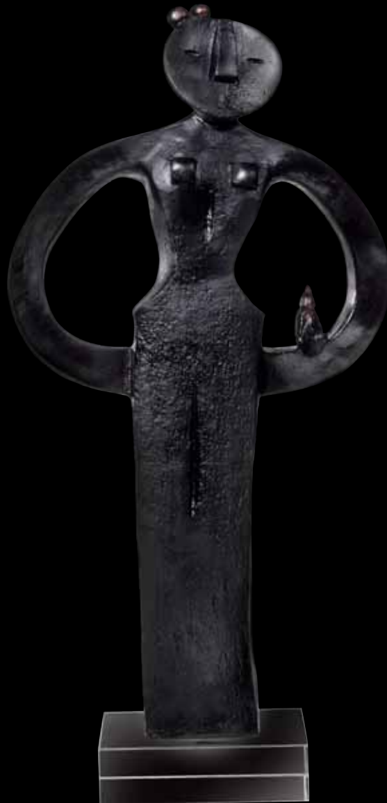
Aronde Édition limitée à 225 ex H: 47 cm - 18 1/2" 03188