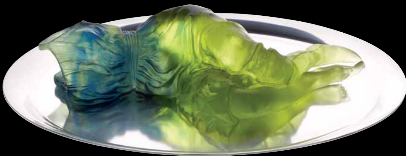
Souvenir d'Amour Édition limitée à 125 ex Ø: 46 cm - 18 1/9" 03445