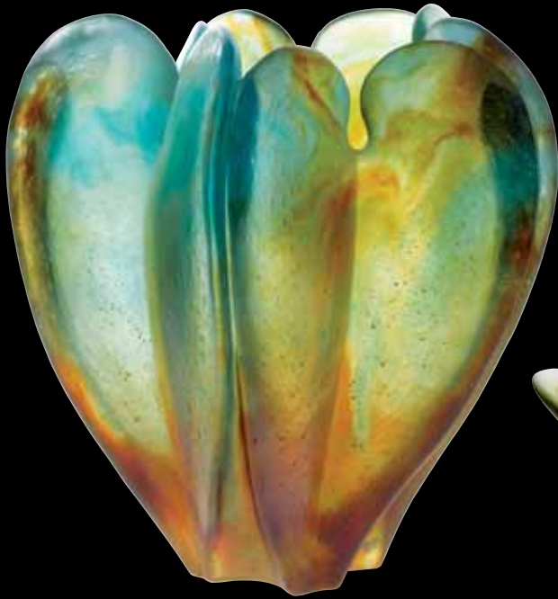
Vase H: 31 cm / Vase H: 31 cm Pièce numérotée / Numbered piece H: 31 cm - 12 1/5" 03484